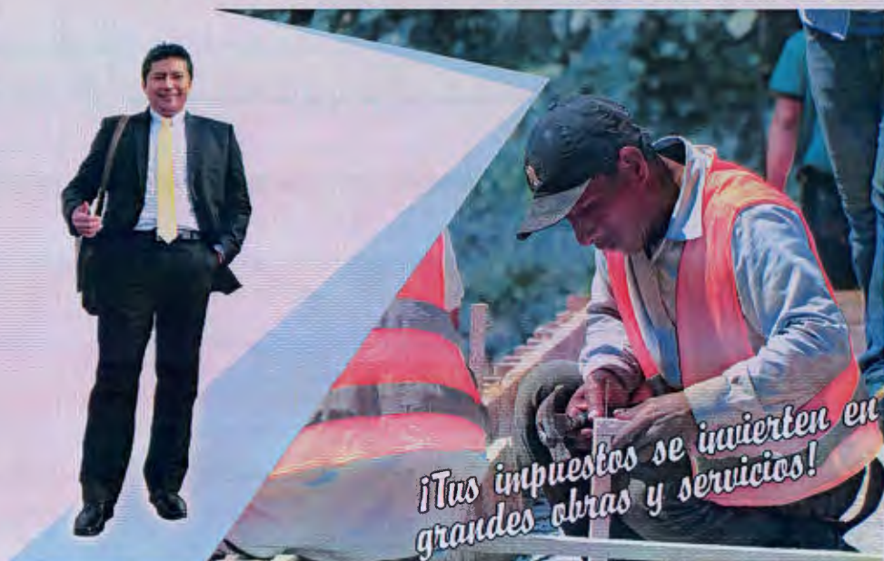
MARDEN ARTURO PAREDES SANDOVAL - ALCALDE